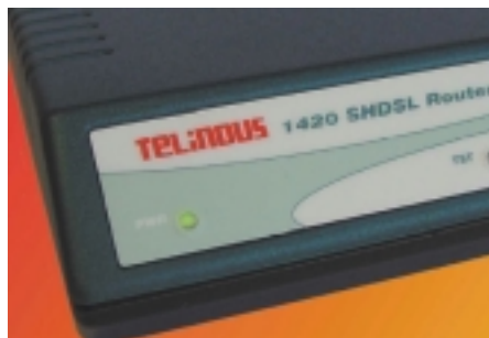
Slika 3. Telindus 1420 SHDSL Router

Telindus 1420 SHDSL router je vrhunski base-band modem sa integrisanim IP router -om koji nudi prenos podataka do 2.3 Mbps preko jedne parice (dve žice). Kao i predhodni Crocus SHDSL modem, Telindus 1420 modem zasnovan je na TC-PAM modulaciji, koja garantuje veće brzine i veća rastojanja. Telindus 1420 SHDSL router se može koristiti kao CPE u kombinaciji sa Frame Relay ili PPP DSLAM-ovima ili u point-to-point vezama. Uređaj dolazi sa jednim 10BaseT Ethernet interfejsom koji ima integrisanu bridge i IP router -sku funkcionalnost. Kada integrisani IP router forward -uje paket, saobraćaj sa LAN-a se enkapsulira za transmisiju preko WAN linka. Router podržava PPP i Frame Relay enkapsulaciju. Serijski interfejsi na router -u mogu biti sa IP adresom ili bez nje ( unnumbered )