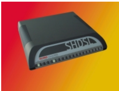
Slika 2. Crocus SHDSL modem

Crocus SHDSL ( Single-pair High bit rate Digital Subscriber Line ) je nova generacija Telindusovih upravljivih baseband modema koji omogućavaju full-duplex prenos podataka do 2.3 Mbps preko jednog dvožičnog kabla. Specijalna 2-parična verzija nudi mogućnost da se podigne brzina prenosa podataka do 4.6 Mbps. Linijska brzina modema se može prilagoditi tako da se optimizira propusni opseg u funkciji karakteristika lokalne petlje. Modemi su zasnovani na novoj modulacionoj tehnologiji, čije je ime TC-PAM ( Trellis Coded Pulse Amplitude Modulation ), a koja garantuje spektralnu kompatibilnost sa starijim i ADSL transmisionim sistemima.